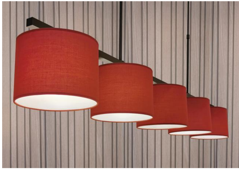
TEFNOUT 5 en bronze griffé avec abat-jour en Coton Groseille (tissu de catégorie 1)