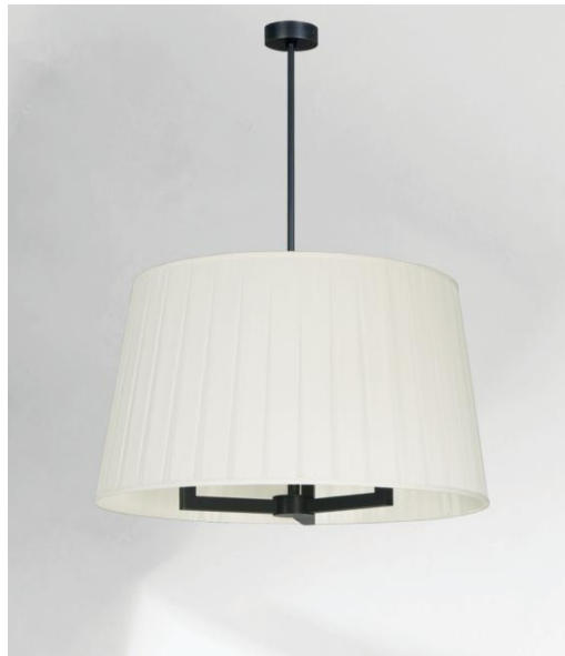
TOURAH 3 LARGE en bronze griffé avec un abat-jour rond de 60cm de diamètre en Plissé Cousu Main