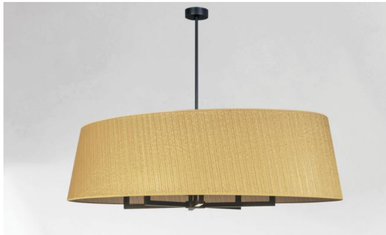
TOURAH 6 OVALE en bronze griffé avec abat-jour ovale de L130cm en Plissé Or (tissu de catégorie 4)