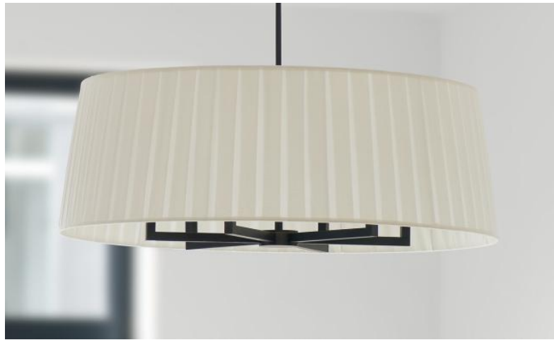
TOURAH 6 LARGE en bronze griffé avec abat-jour Ø100cm en Plissé Cousu Main