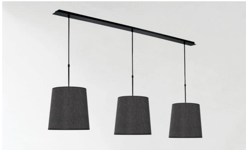
MEREROUKA 3 en bronze griffé avec trois abat-jour ronds coniques en Stone Diorite (tissu de catégorie 4)