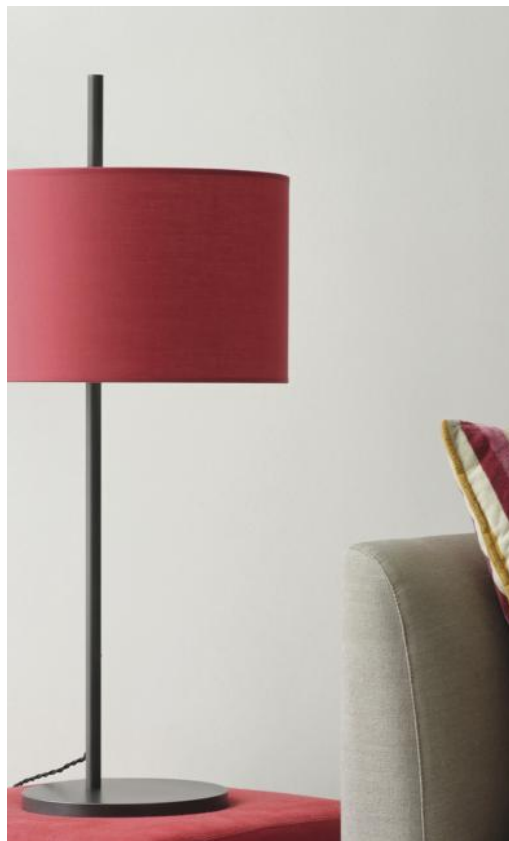
MENDES en bronze griffé avec abat-jour en Coton Groseille (tissu de catégorie 1)