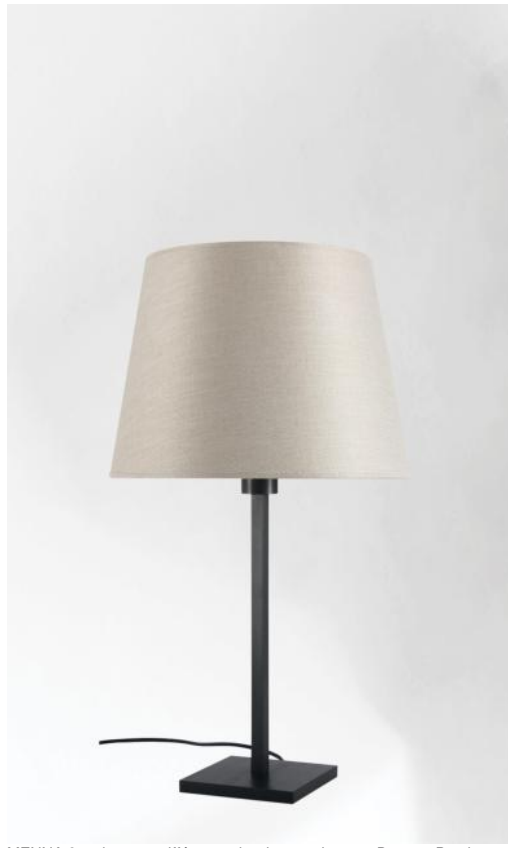
MENNA 2 en bronze griffé avec abat-jour conique en Dreams Bambou (tissu de catégorie 2)