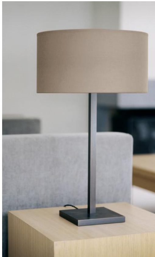
MENNA 3 en bronze griffé avec un abat-jour cylindrique en Seta Pirée (tissu de catégorie 3)