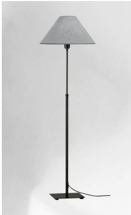
IPOUKY en bronze griffé avec abat-jour en Parma Cendré (tissu de catégorie 4)