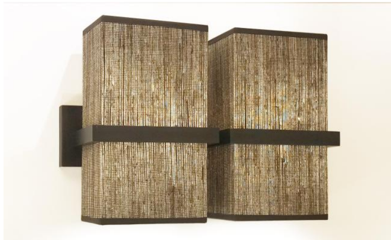
TETI 2 en bronze griffé avec deux abat-jour rectangulaires en Jacinthe Miel Noir (matière de catégorie 5)