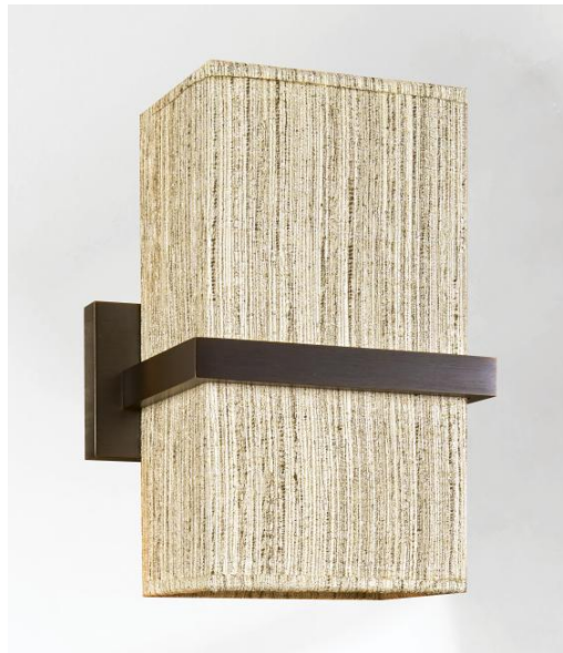
TETI 1 en bronze griffé avec un abat-jour rectangulaire en Turda Blond (tissu de catégorie 3)