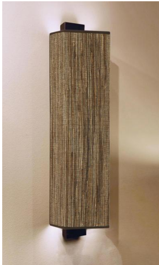
CHABAKA 2 en bronze griffé avec abat-jour en Jacinthe Miel Noir (matière de catégorie 5)