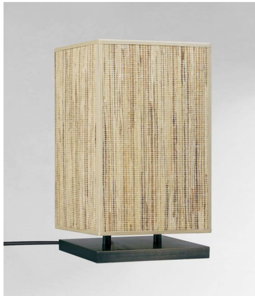
NAOS 2 en bronze griffé avec abat-jour en Jacinthe Naturelle (matière de catégorie 5)