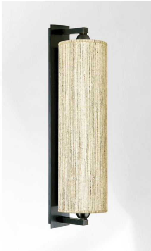
KHONSOU en bronze griffé avec abat-jour en Turda Blond (tissu de catégorie 3)