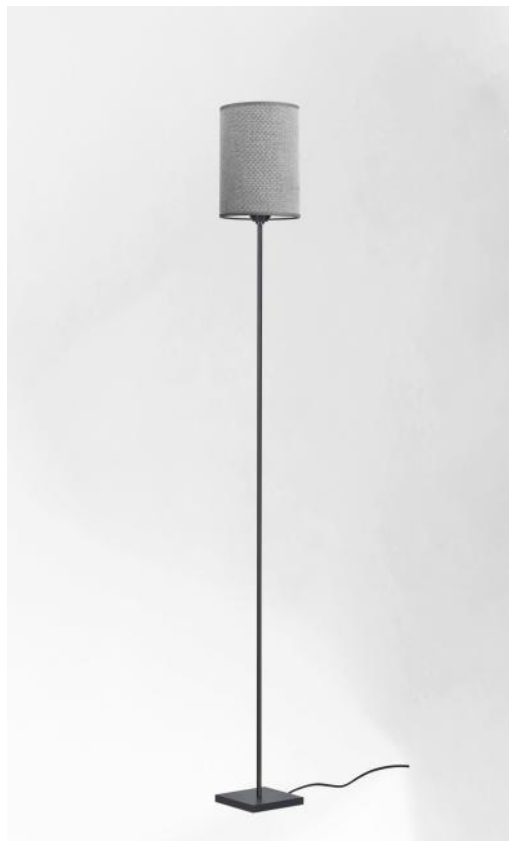
KAWA en bronze griffé avec abat-jour en Parma Cendré (tissu de catégorie 4)