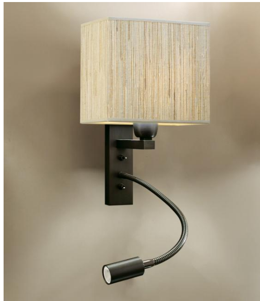
KARY bronze griffé avec abat-jour en Jacinthe Naturelle (matière cat.5)