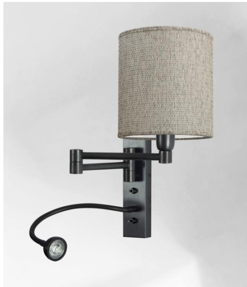
AHMES en bronze griffé avec abat-jour en Esmaria Avoine (tissu de catégorie 3)