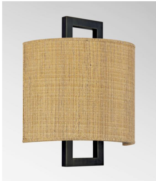
KARANIS 1 en bronze griffé avec abat-jour en Turda Abricot (tissu de catégorie 3)