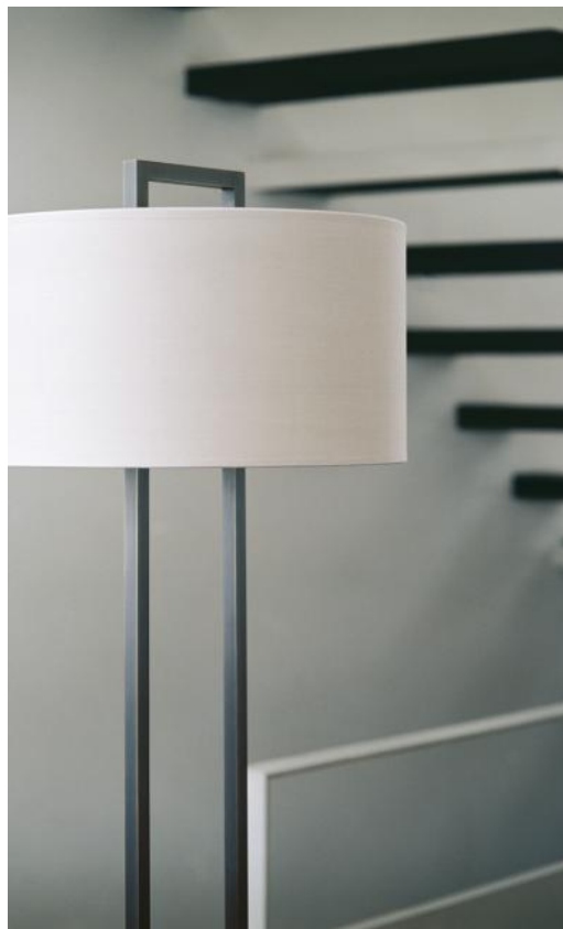
SATIS FLOOR en bronze griffé avec abat-jour en Coton Calcaire (tissu de catégorie 1)