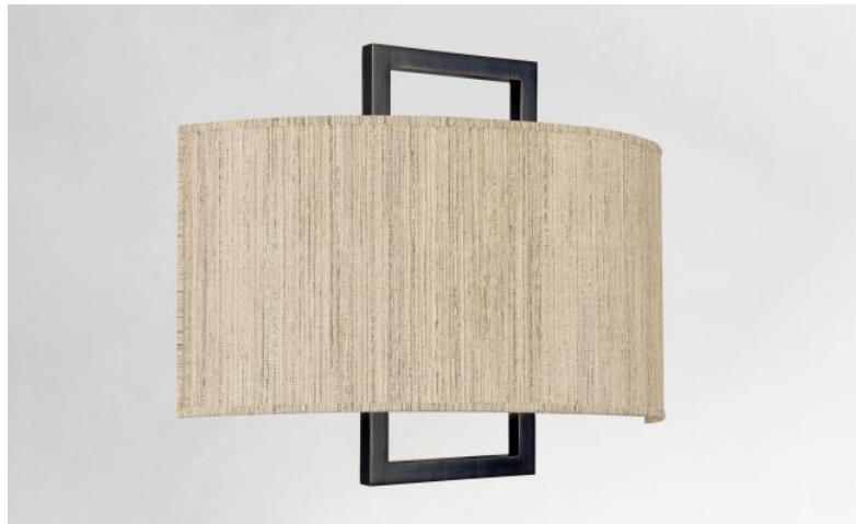
KARANIS 2 en bronze griffé avec abat-jour en Turda Blond (tissu de catégorie 3)