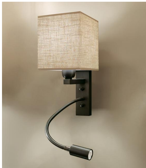
KARY en bronze griffé, abat-jour en Parma Merisier (tissu cat.4)