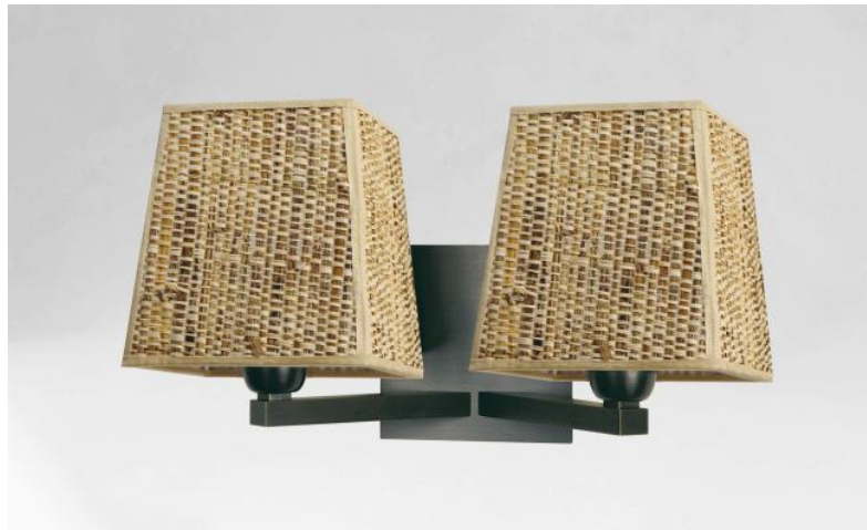
SECHAT en bronze griffé avec abat-jour en Raphia Banane (matière de catégorie 3)