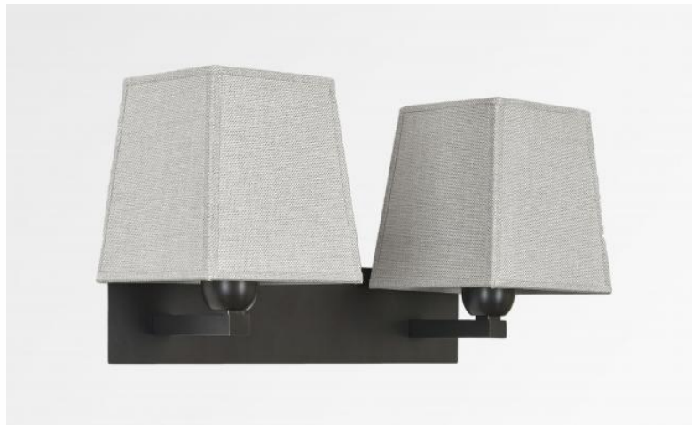
MONTOU en bronze griffé avec abat-jour en Dreams bambou (tissu de catégorie 2)