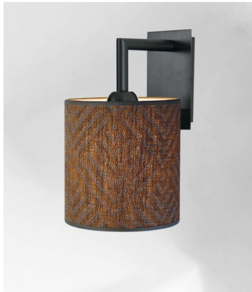
EDFOU 2 en bronze griffé avec abat-jour en Arrow Casamance (tissu de catégorie 4)