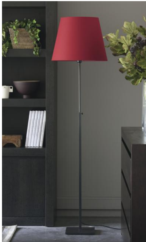
ZABARAH en bronze griffé avec abat-jour en Seta Vermillon (tissu de catégorie 3)