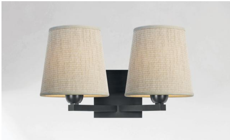
SECHAT en bronze griffé avec abat-jour en Parma Merisier (tissu de catégorie 4)