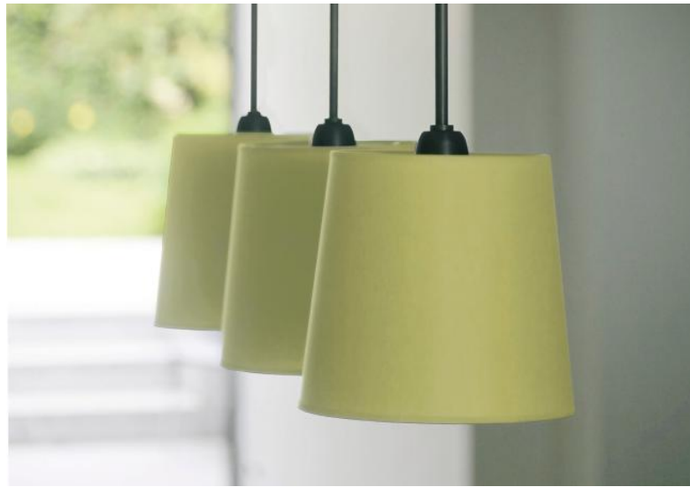
ARSINOE en bronze griffé avec abat-jour ronds en Coton Vert Prairie (tissu de catégorie 1)