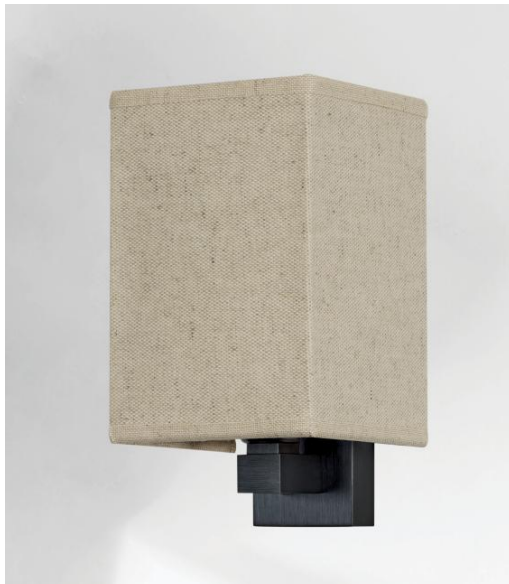
FAYOUM en bronze griffé avec abat-jour en Lin Pirée (tissu catégorie 2)