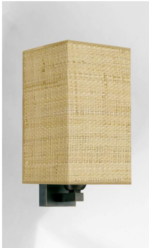
AMADA en bronze griffé avec abat-jour en Raphia Nature (cat.3)