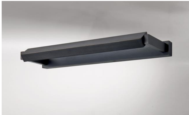
ERATO 35 en bronze griffé. Finition du métal : code 29