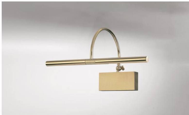
PACHED 25 en laiton (poli et satiné). Finitions du métal : code 20