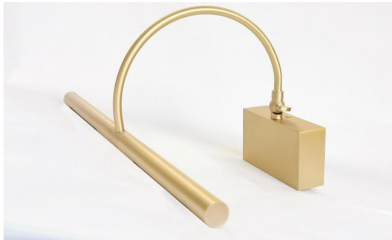
PACHED en laiton satiné. Finition du métal : code 25