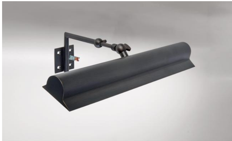
ET 33 en bronze griffé. Finition du métal : code 29