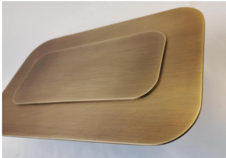
KAÏTO in leicht Bronze. Metalloberfläche Code: 28