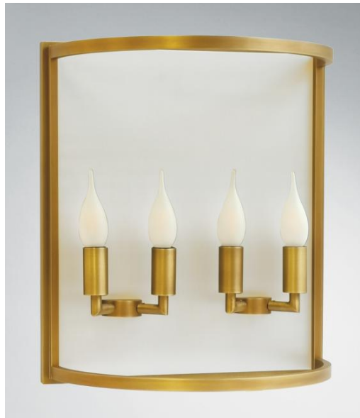
CHEVERNY o35 in leicht Bronze. Metalloberfläche Code: 28