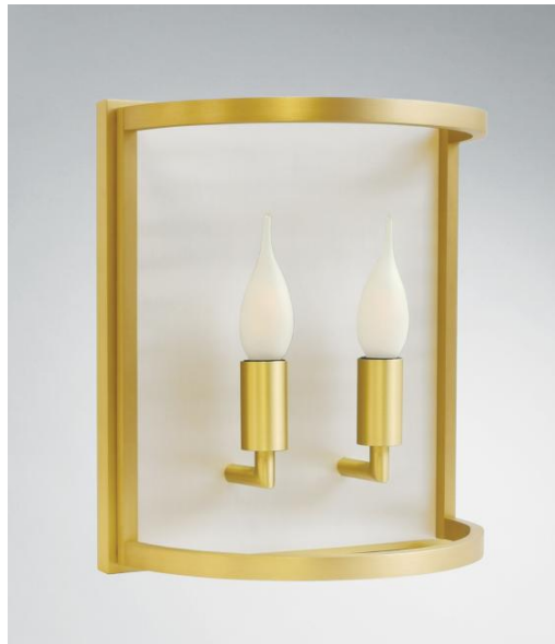
CHEVERNY o25 in gebürstet Messing. Metalloberfläche Code: 25