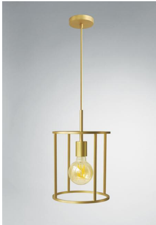
CHAMBORD o22 in gebürstet Messing. Metalloberfläche Code: 25