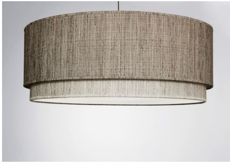
Lampenschirm KOUBAN 70 in Turda Châtain (Stoffe aus Kategorie 3) mit Ring in Turda Blond