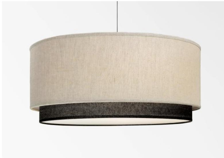
Lampenschirm Kouban 50 in Lin Moscou (Stoffe aus Kategorie 2) mit Ring in Stone Diorite