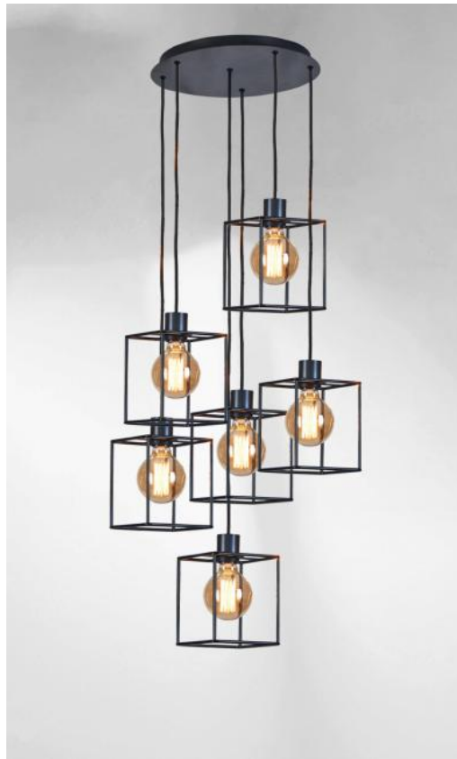
KERMA 6 o38 in gebürstet Bronze mit Strukturen in schwarzem Epoxy