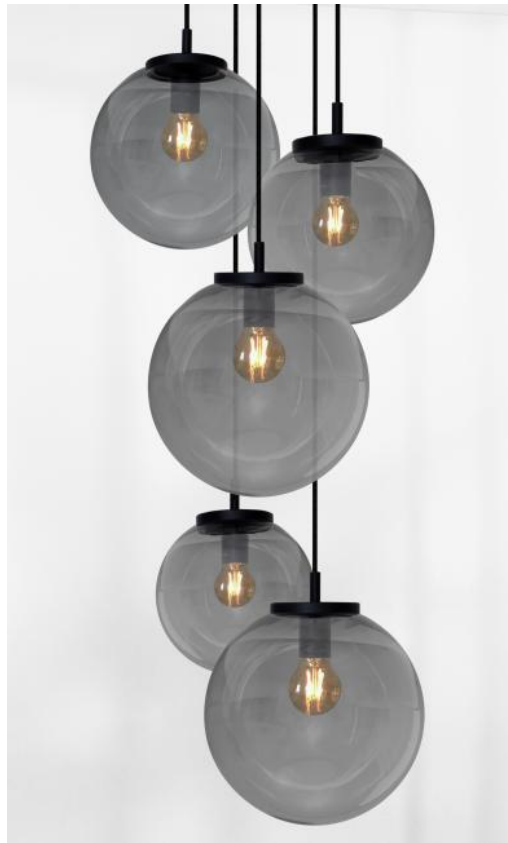
FORYOU 5 o33 in Schwarz strukturiert (Code 02) mit anthrazit Gläsern (Code 82)