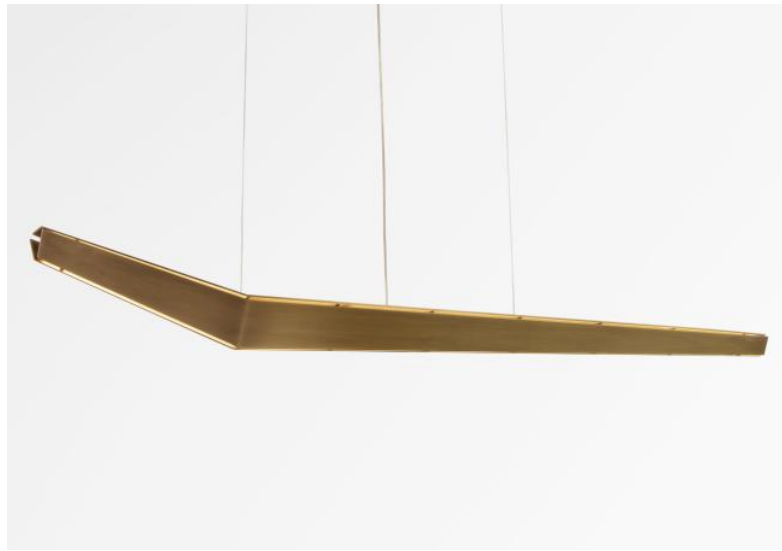
LUNGA # in leicht Bronze