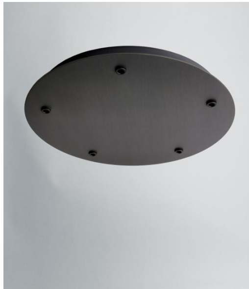
CEILING BASE 5 o33 in gebürstet Bronze. Metalloberfläche Code: 29. Optionen: eine große Auswahl an Kabeln und Fassungen (+Supplement)