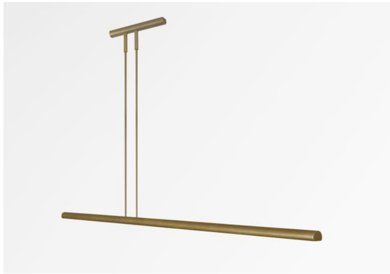
AXELL 90 in light bronze