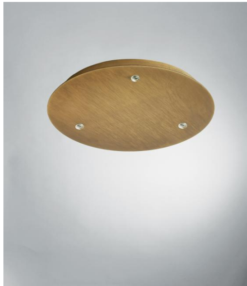
CEILING BASE 3 o26 in leicht Bronze. Metalloberfläche Code: 28. Optionen: eine große Auswahl an Kabeln und Fassungen (+Supplement)