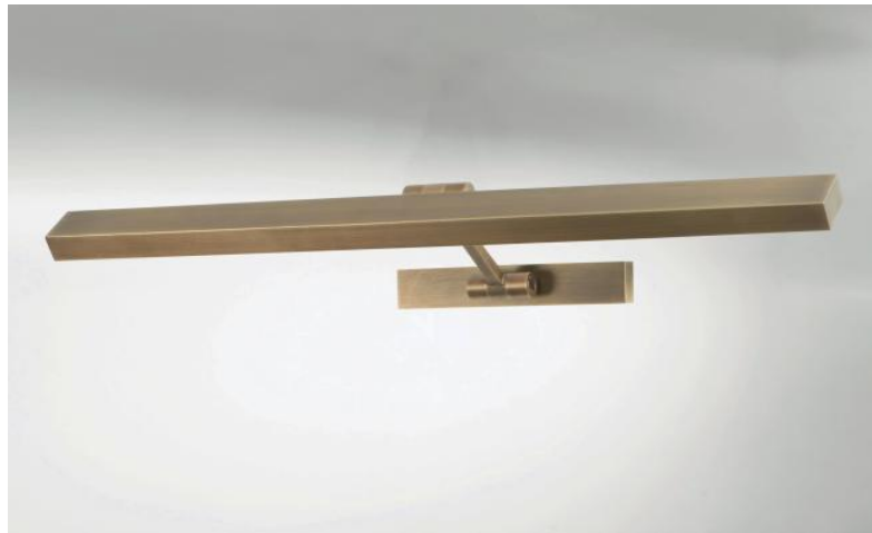
OUBA 65 in leicht Bronze. Metalloberfläche Code: 28