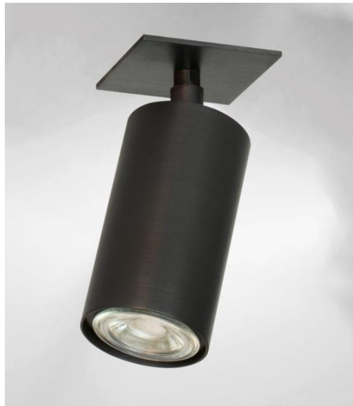
DEIMOS P1 # in gebürstet Bronze. Metalloberfläche Code: 29