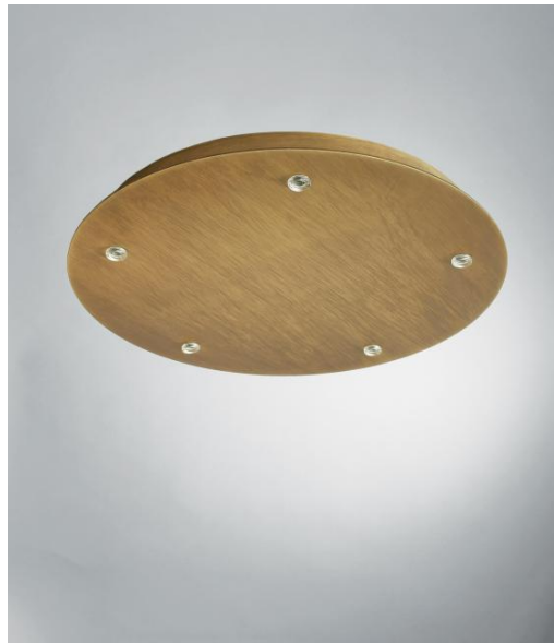
CEILING BASE 5 o26 in leicht Bronze (Option). Metalloberfläche Code: 28. Optionen: eine große Auswahl an Kabeln und Fassungen (+Supplement)