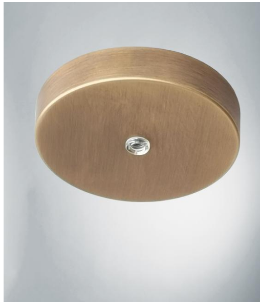
CEILING BASE 1 o10 in leicht Bronze. Metalloberfläche Code: 28. Optionen: eine große Auswahl an Kabeln und Fassungen (+Supplement)