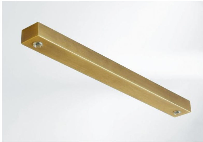
CEILING BASE L 2 in leicht Bronze (Option). Metalloberfläche Code: 28. Optionen: eine große Auswahl an Kabeln und Fassungen (+Supplement)