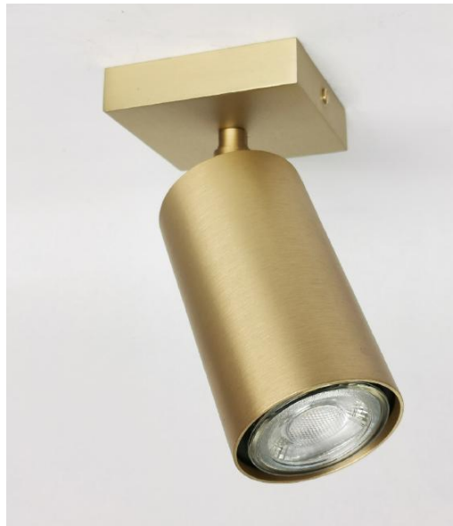
DEIMOS S1 # in gebürstet Messing. Metalloberfläche Code: 25